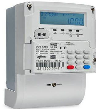
কী-প্যাড স্মার্ট প্রি-পেমেন্ট মিটার

উল্লেখ্য, নেসকো কর্তৃক কী-প্যাড স্মার্ট মিটার সরবরাহ ও স্থাপন করা হচ্ছে।