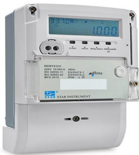
স্মার্ট কার্ড প্রি-পেমেন্ট মিটার

স্মার্ট প্রি-পেমেন্ট মিটার দুই প্রকারঃ স্মার্ট কার্ড ও কী-প্যাড স্মার্ট মিটার।